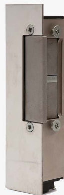
Elektrozaczep wzmocniony 44.4.00.B