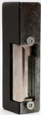
Elektrozaczep standardowy 10.0.00.B