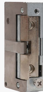
Elektrozaczep standardowy 50.MA.1.00.B

Szczegółowe informacje znajdują się na stronach www.elektrozaczepy.pl i www.laskomex.com.pl