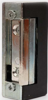
Elektrozaczep symetryczny 30.1.00.B