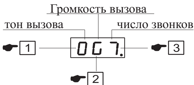
Рис. 2 Меню пользователя